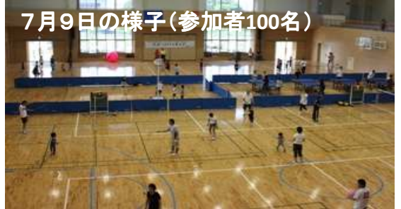
7月9日の様子(参加者100名)

～開催場所～ 《佐土原体育館》 ～開催日～ 9月7・14・21・28日 10月5・12・19・26日 ～時間～ 19:00～20:30